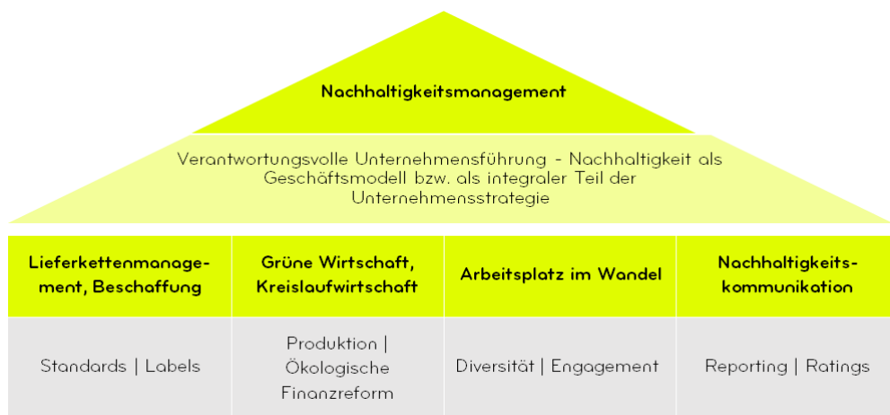
Abb. 2: Die vier Themenschwerpunkte von öbu: Nachhaltiges Lieferkettenmanagement & Beschaffung, Kreislaufwirtschaft & Grüne Wirtschaft, Arbeitsplatz im Wandel sowie Nachhaltigkeitskommunikation.

öbu versteht Nachhaltigkeit als integralen Bestandteil der Unternehmensstrategie, was langfristig die Wettbewerbsfähigkeit der Schweizer Wirtschaft sichert. Dazu gehört auch der strategische Entscheidung, die soziale und ökologische Verantwortung (Corporate Responsibility) wahrzunehmen, um dadurch den ökonomischen Erfolg auf eine verantwortungsvolle und sichere Basis zu stellen (übergeordnetes Thema „Nachhaltigkeitsmanagement und Leadership“). öbu hat 2015 aufgrund der aktuellen Megatrends, der 17 UN-Ziele für eine nachhaltige Entwicklung und entsprechend der Mitgliederbedürfnisse vier Themenschwerpunkte identifiziert, auf die sich der Verband derzeit fokussiert (s. Abb. 2).