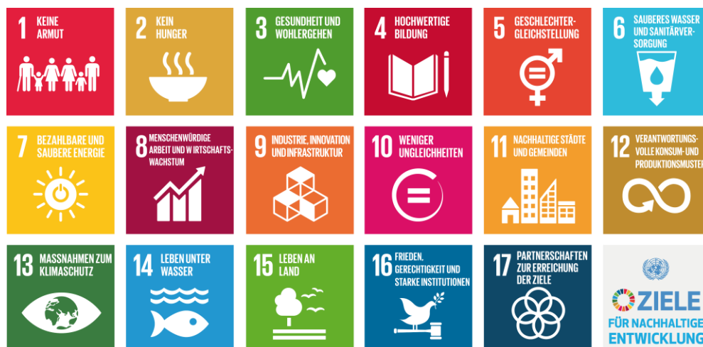
Abb. 3: Die 17 UN Ziele für eine nachhaltige Entwicklung

Unsere Themenschwerpunkte beziehen sich auf die aktuellen nachhaltigkeitsbezogenen Herausforderungen in der Schweiz, aber auch auf globaler Ebene. Wir orientieren uns u. a. an den internationalen Vorgaben der von der UNO-Staatengemeinschaft im September 2015 verabschiedeten Agenda 2030 für nachhaltige Entwicklung mit ihren 17 Zielen ( Sustainable Development Goals, SDG ). öbu unterstützt Unternehmen dabei, einen aktiven Beitrag zu den SDG zu leisten und diesen auch zu messen.